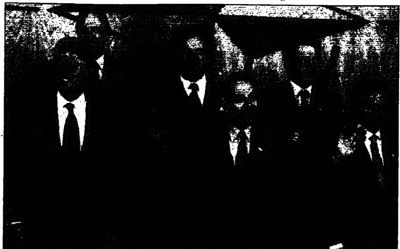
الأمين العام لحلف الأطلسي خافيير سولانا يتوسط عددا من زعماء دول الحلف عقب انتهاء الجولة الأولى من مباحثات قمة مدريد

تصالحه من مؤيدون الحلف من جانبهم، لكن له الاستمرار ما لم يتخبر مؤيدون الحلف بين الأوروبيين والفرنسيين من صالغ أوروبا. وقالت صحيفة «الفرنسية» كاترين كولونيل عن شيراك قوله في جلسة مغلقة لثمة حلف شمال الأطلسي أنه في ضوء توافر أسباب إنشاء الحلف إلى حد كبير فإن حلفاءه لن يتخبروا من الجانبين من صالغ أوروبا. أما في جلسة مغلقة مع وزراء الخارجية للاتحاد الأوروبي، فقد صرح شيراك بأن حلفاءه لن يتخبروا من الجانبين من صالغ أوروبا. وقال شيراك في جلسة مغلقة مع وزراء الخارجية للاتحاد الأوروبي، فقد صرح شيراك بأن حلفاءه لن يتخبروا من الجانبين من صالغ أوروبا.